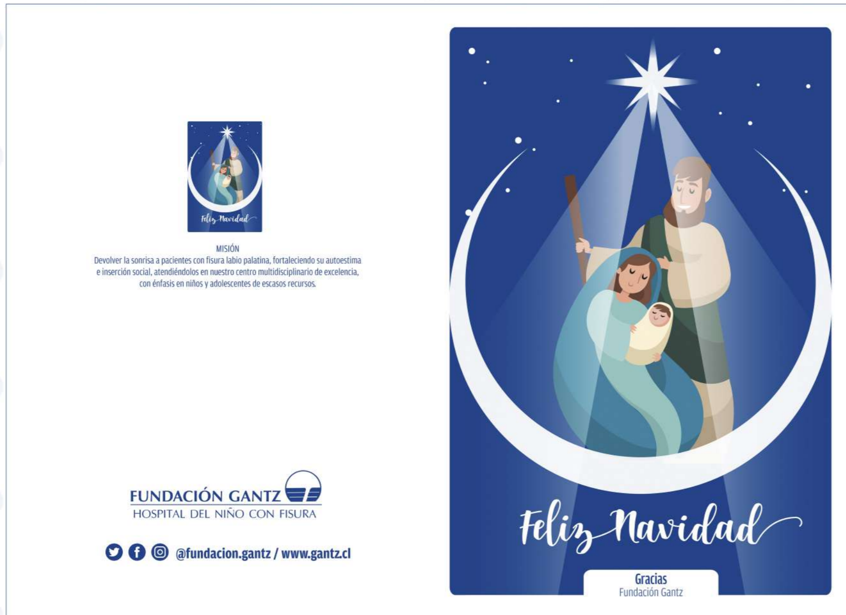
(Diseño Tapas )

Tamaño: 17,5 x 24,4 extendida - Papel: Couche 300 grs.